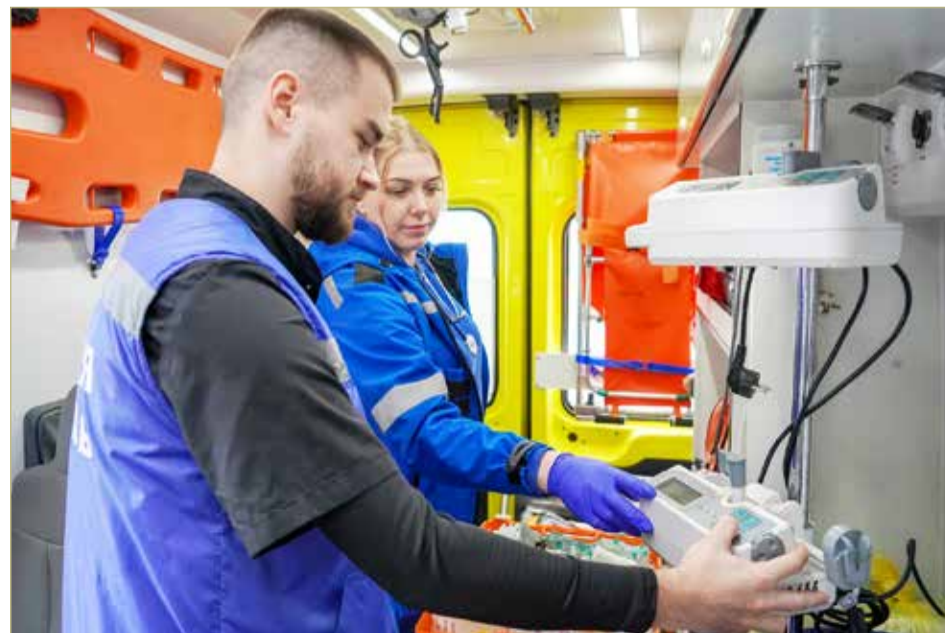
Работники скорой — это передовой отряд и универсальные бойцы.

— Население у нас прекрасное! Отойдя от шока, выдохнув, часто говорят спасибо, извиняются, если были резки в моменте. Мы всё это понимаем. Но мы и не ждём благодарности. Главное — вовремя приехать и сделать всё как надо. По цепочке передать коллегам-медикам пациента после грамотно оказанной первой помощи. А уже потом, когда коллеги в своих отчётах или рассказах отметят, что «вовремя доездили», мы выдохнем: за этими простыми словами стоит очень большой смысл. Мы хорошо выполнили свой этап работы. Благодаря этому следующие звенья смогли сохранить нашему пациенту здоровье. И тоже отработали как надо.