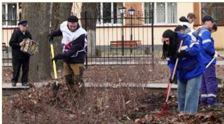
«Генеральная уборка» объединила общей идеей жителей, представителей власти, депутатский корпус и бизнес-сообщество.

воинских захоронений, памятников, обелисков и других мемориальных сооружений приведены в порядок.