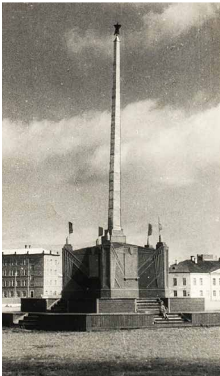
В первую годовщину Победы – 9 мая 1946 года – в Новгороде установили первый памятник, посвящённый Дню Победы.

В первую годовщину Победы в Новгороде появился и первый памятник, посвящённый Дню Победы. Это был деревянный обелиск с пятиконечной звездой на деревянном постаменте. 1 мая 1946 года