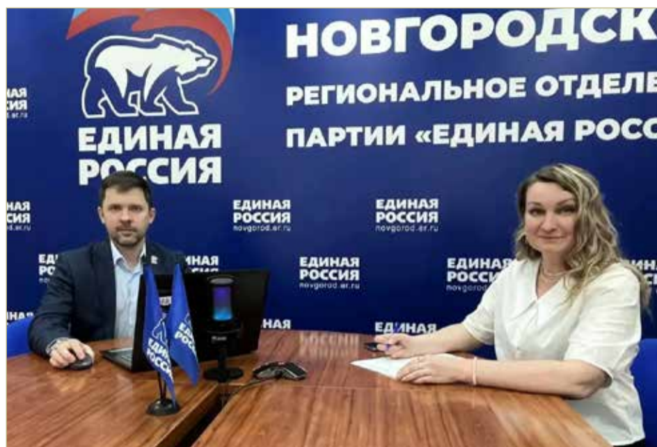
По мнению кандидатов в кандидаты, предварительное голосование помогает узнать, сколько избирателей тебя поддерживает.

Зарегистрироваться в качестве избирателя на сайте предварительного голосования можно до 29 мая с верификацией через портал госуслуг. На данный момент уже зарегистрировалось более 25 тысяч избирателей. Само голосование пройдёт с 25 по 31 мая на сайте ПГ.