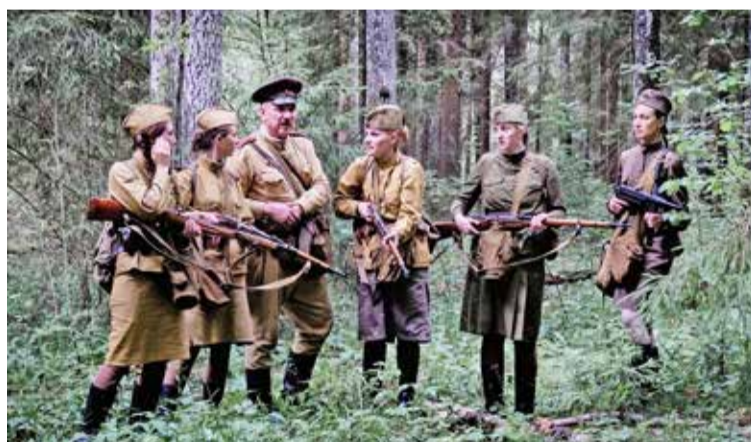
Участники клуба снимают фильмы, вживаются в свои роли, чтобы лучше понимать мотивы людей, воевавших в Великой Отечественной войне.

– Мы не только участники клуба, но и хорошие друзья. Три года назад собрались все вместе своей компанией 9 мая, чтобы отметить праздник Победы. Включили наш любимый фильм «А зори здесь тихие...». И как-то неожиданно обнаружили, что мои знакомые девчата подходят под описание героинь повести Бориса Васильева. Так