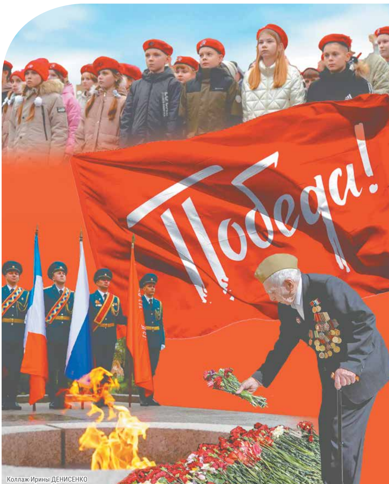
Коллаж Ирины ДЕНИСЕНКО