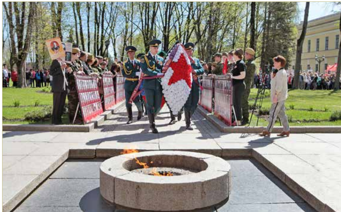
Мероприятия Дня Победы начнутся у мемориала «Вечный огонь славы».